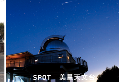
SPOT | 美星天文台