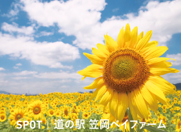
SPOT | 道の駅 笠岡ベイファーム