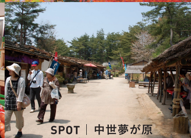
SPOT | 中世夢が原