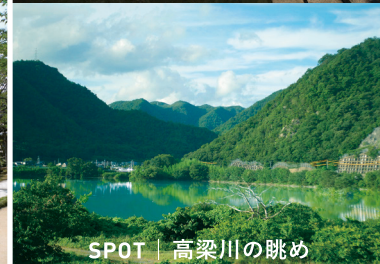
SPOT | 高梁川の眺め