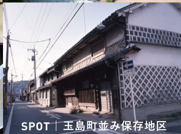
SPOT | 玉島町並み保存地区