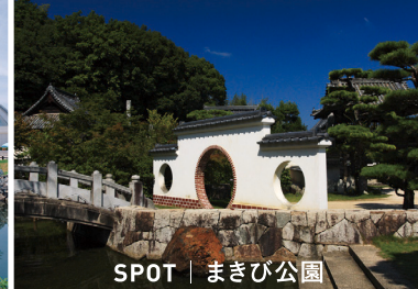
SPOT | まきび公園