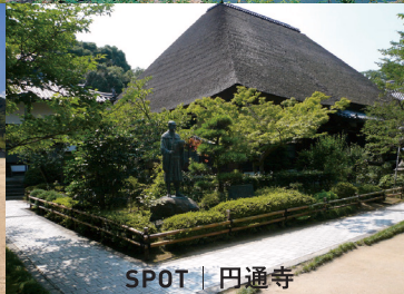
SPOT | 円通寺