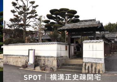
SPOT | 横溝正史疎開宅