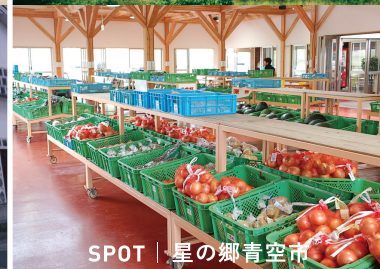
SPOT | 星の郷青空市