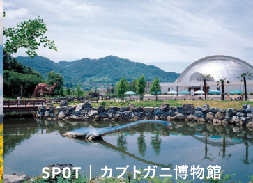
SPOT | カプトガニ博物館