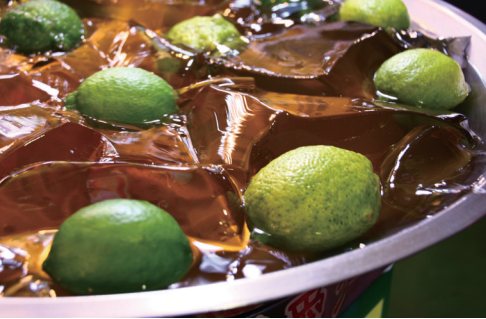
愛玉子 オーギーョーティ

「愛玉子」という果実から作られるゼリー。レモンシロップでさっぱりと頂くスイーツです。