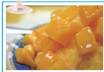
芒果冰 マンゴーピン

もちもちなブラックパールの入ったタピオカミルクティー。本場台湾に来たら飲むべき一品。