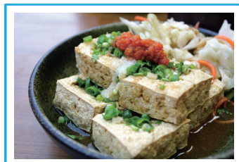
臭豆腐 チョウドウフ

台湾では朝食店が多数あり、長蛇の列ができる人気店も。定番メニューは、温かい豆乳に揚げパンやネギなどの具材が入った「鹹豆漿（シェンドウジャン）」、香ばしい厚焼きのパンに卵焼きを挟んだ「厚餅夾蛋（ホウピンジャータン）」。他にも美味しいメニューが盛りだくさん。朝からお腹いっぱい楽しめます。