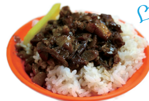
魯肉飯 ルーローハン

甘さ控えめの豆乳を固めたデザート。ピーナッツやタピオカ、フルーツなどをトッピングして、いただきます！夏は冷たく、冬はホットも◎