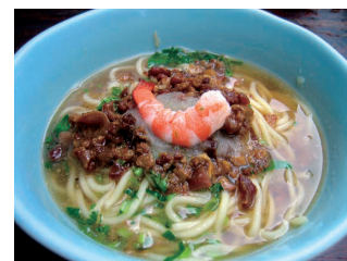
担仔麵 タンツーメン

細かく刻んだ豚肉を、香辛料と煮込んでご飯にかけたB級グルメ。甘辛い煮汁が毎日食べたくなる絶品のおいしさです。