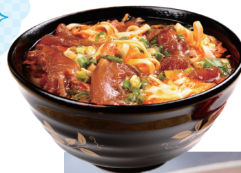
牛肉麵 ニュウロウメン

中細の麺にそばろ肉と海老、香草をトッピングした、台南名物の汁そば。海老の頭でダシをとったスープが旨味たっぷりで美味しい！