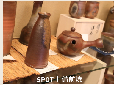
SPOT | 備前焼

美作市周辺協力店 (マップ範囲外) 灘屋旅館 [美作市裏加部291] / 勝田観光振興会(ギャラリー-山村茶屋) [美作市東谷下302-1]