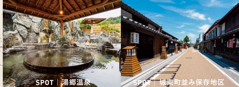
SPOT | 湯郷温泉