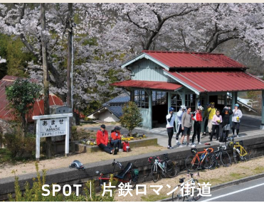
SPOT | 片鉄ロマン街道