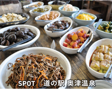
SPOT | 道の駅 奥津温泉