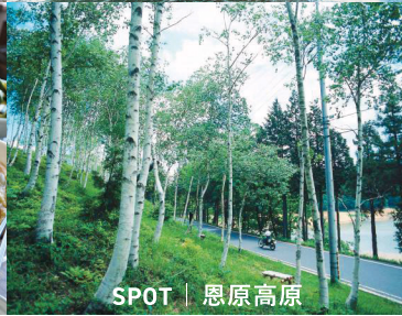
SPOT | 恩原高原