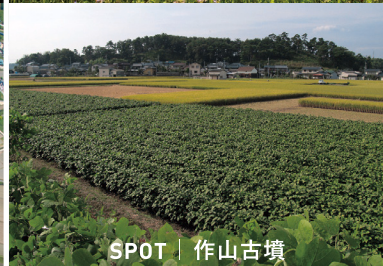
SPOT | 作山古墳