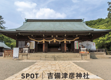
SPOT | 吉備津彦神社