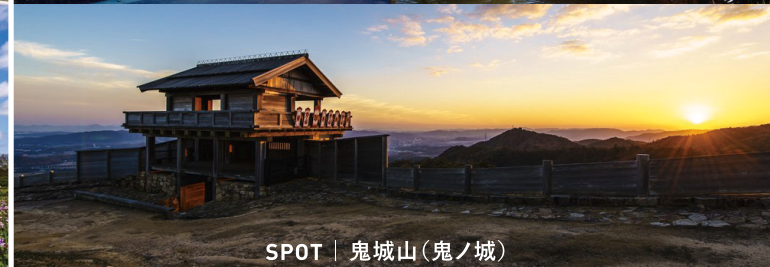
SPOT | 鬼城山(鬼ノ城)