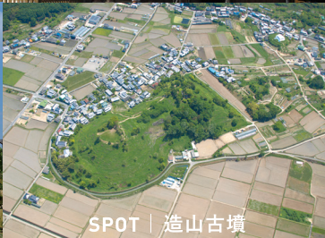
SPOT | 造山古墳