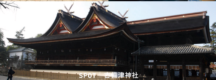
SPOT | 吉備津神社