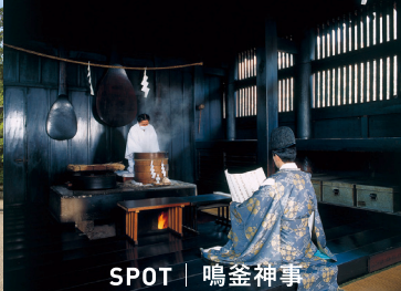
SPOT | 鳴釜神事