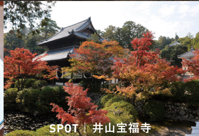
SPOT | 井山宝福寺