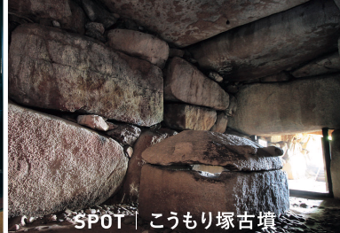
SPOT | こうもり塚古墳