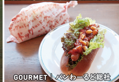
GOURMET | パンわーど総社