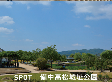
SPOT | 備中高松城址公園