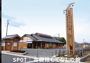
SPOT | 吉備路もてなしの館