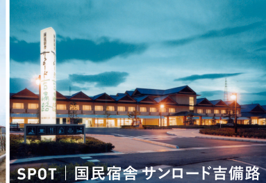
SPOT | 国民宿舎 サンロード吉備路