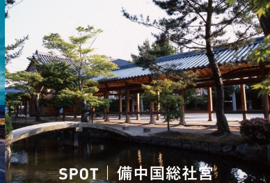
SPOT | 備中国総社宮