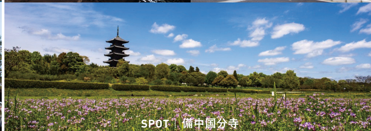
SPOT | 備中国分寺