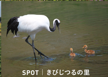
SPOT | きびじつりの里