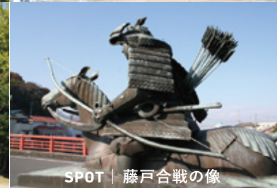
SPOT | 藤戸合戦の像