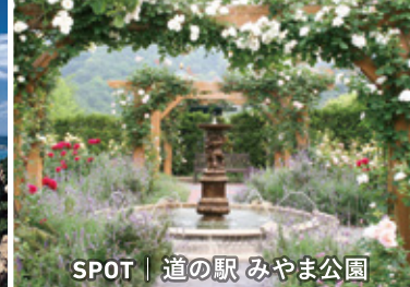
SPOT | 道の駅 みやま公園