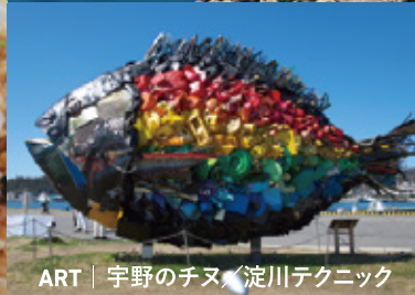
ART | 宇野のチヌ／淀川テクニク