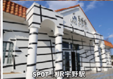
SPOT | JR宇野駅