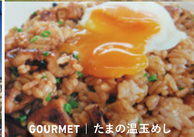
GOURMET | たまの温玉めし