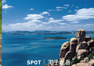
SPOT | 王子が岳