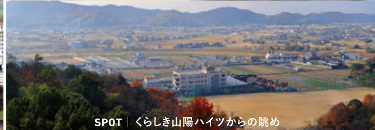
SPOT | くらしき山陽ハイツからの眺め