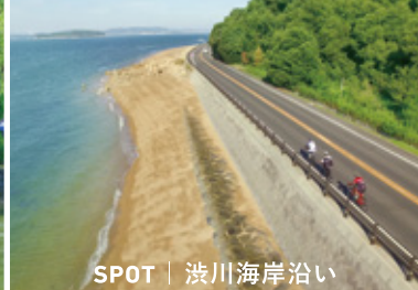
SPOT | 渋川海岸沿い