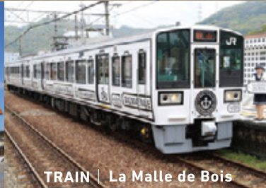
TRAIN | La Malle de Bois