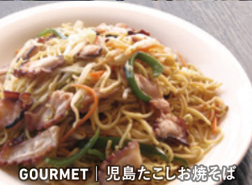
GOURMET | 児島たこしお焼そば