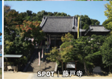
SPOT | 藤戸寺