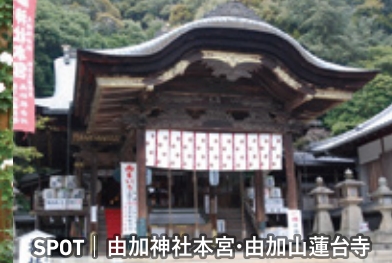
SPOT | 由加神社本宮・由加山蓮台寺