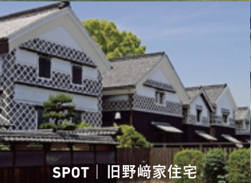
SPOT | 旧野崎家住宅