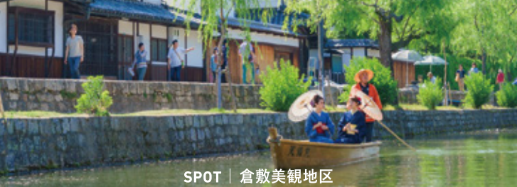
SPOT | 倉敷美観地区