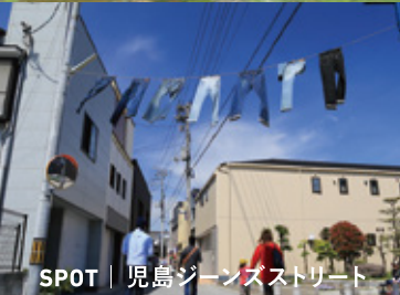
SPOT | 児島ジーンズストリート