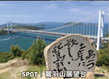
SPOT | 鷺羽山展望台