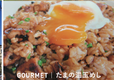
GOURMET | たまの温玉めし