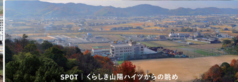
SPOT | くらしき山陽ハイツからの眺め