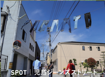
SPOT | 児島ジーンズストリート