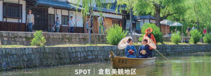
SPOT | 倉敷美観地区