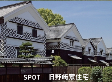
SPOT | 旧野崎家住宅