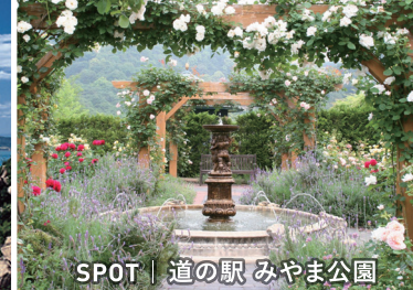
SPOT | 道の駅 みやま公園