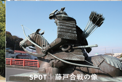
SPOT | 藤戸合戦の像