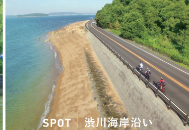
SPOT | 渋川海岸沿い