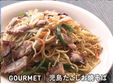
GOURMET | 児島たこしお焼そば