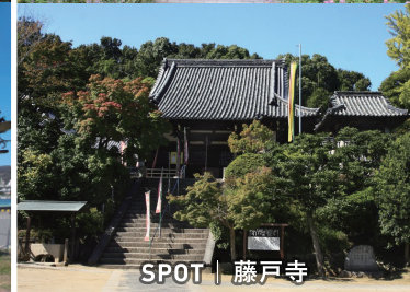
SPOT | 藤戸寺