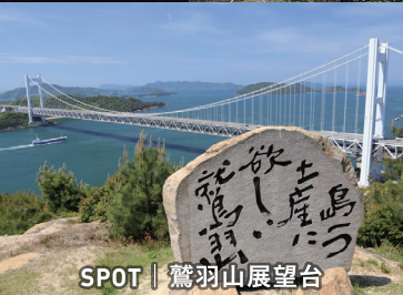
SPOT | 鷺羽山展望台