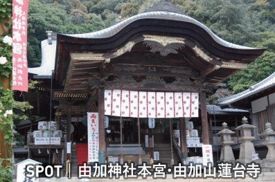
SPOT | 由加神社本宮・由加山蓮台寺