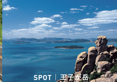
SPOT | 王子が岳