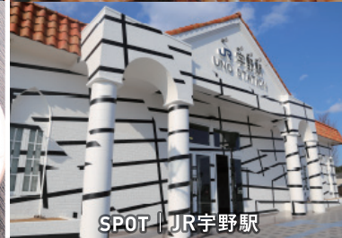
SPOT | JR宇野駅