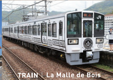
TRAIN | La Malle de Bois