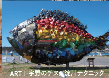
ART | 宇野のチヌ／淀川テクニック