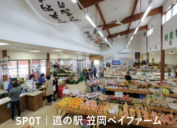
SPOT | 道の駅 笠岡ベイファーム