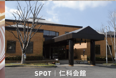
SPOT | 仁科会館