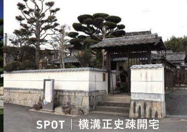
SPOT | 横溝正史疎開宅