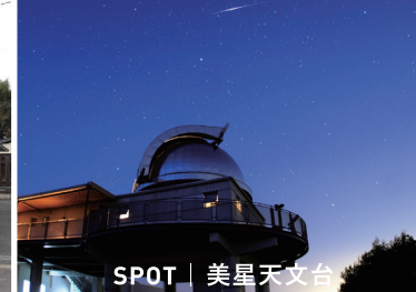
SPOT | 美星天文台