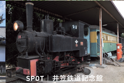
SPOT | 井笠鉄道記念館