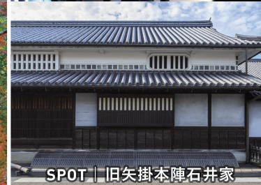
SPOT | 旧矢掛本陣石井家