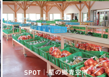
SPOT | 星の郷青空市