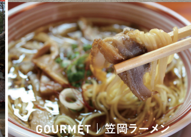
GOURMET | 笠岡ラーメン