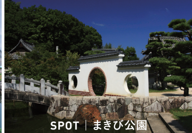
SPOT | まぎび公園