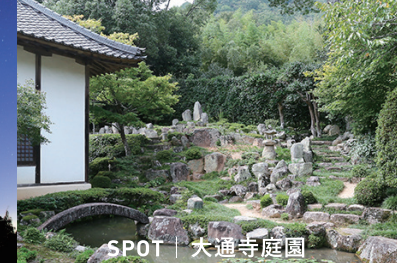
SPOT | 大通寺庭園