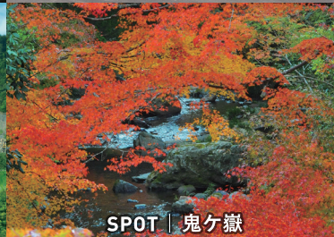
SPOT | 鬼ヶ嶽