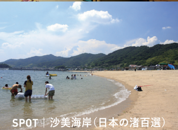
SPOT | 沙美海岸 (日本の渚百選)