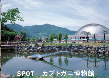
SPOT | カプトガニ博物館