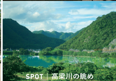
SPOT | 高梁川の眺め