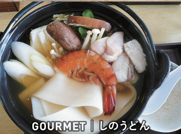
GOURMET | しのうどん