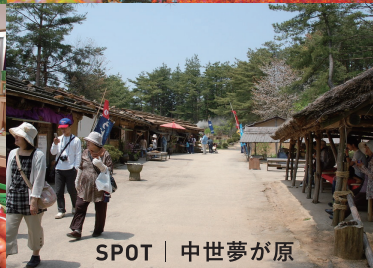
SPOT | 中世夢が原