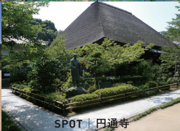
SPOT | 円通寺