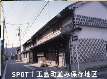
SPOT | 玉島町並み保存地区