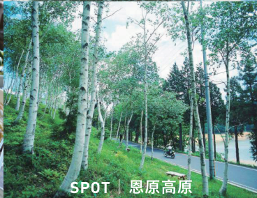
SPOT | 恩原高原