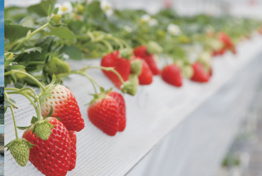
SPOT | 山田養蜂場 みつばち農園