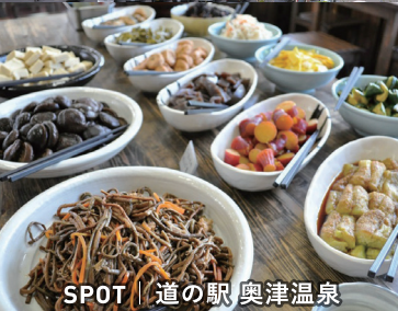
SPOT | 道の駅 奥津温泉