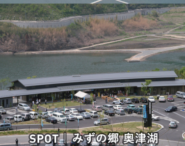
SPOT | みずの郷 奥津湖