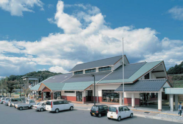
SPOT | 道の駅 久米の里