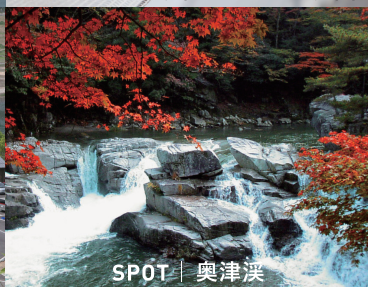
SPOT | 奥津溪