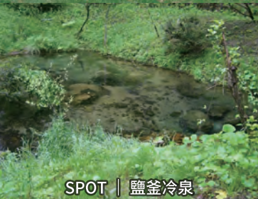
SPOT | 鹽釜冷泉