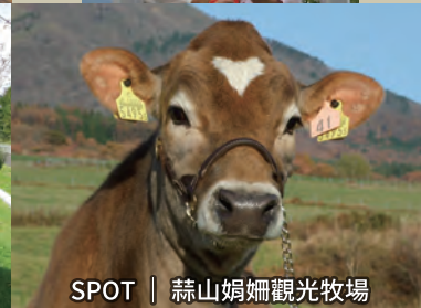
SPOT | 蒜山娟婁觀光牧場