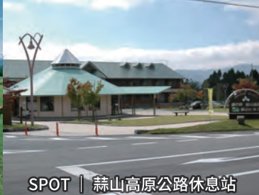
SPOT | 蒜山高原公路休息站