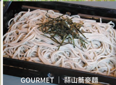
GOURMET | 蒜山蕎麥麵