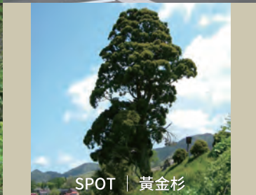
SPOT | 黃金杉