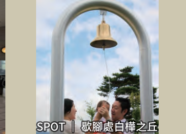
SPOT | 歇腳處白樺之丘