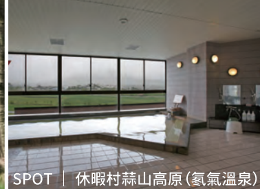
SPOT | 休暇村蒜山高原(氫氣溫泉)