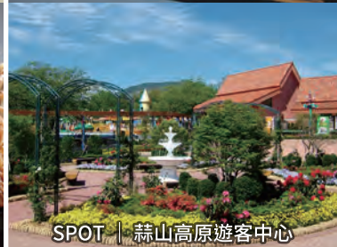
SPOT | 蒜山高原遊客中心