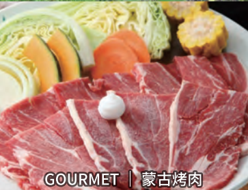
GOURMET | 蒙古烤肉