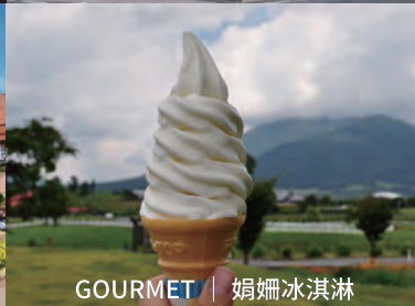
GOURMET | 娟婁冰淇淋