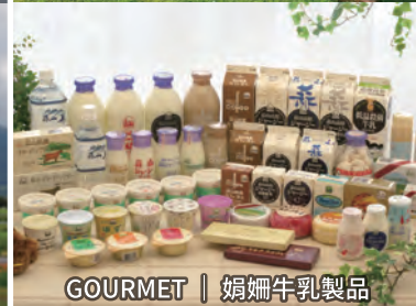
GOURMET | 娟婁牛乳製品