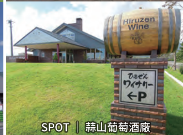
SPOT | 蒜山葡萄酒廠