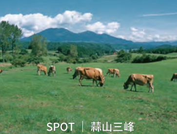
SPOT | 蒜山三峰