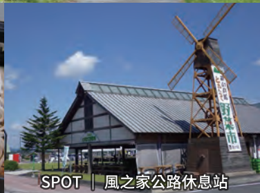
SPOT | 風之家公路休息站