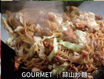
GOURMET | 蒜山炒麵