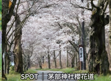
SPOT | 茅部神社櫻花道