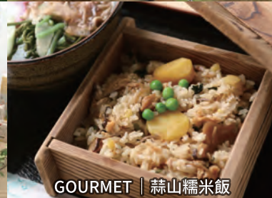
GOURMET | 蒜山糯米飯