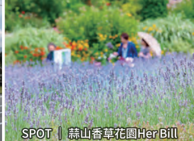
SPOT | 蒜山香草花園Her Bill