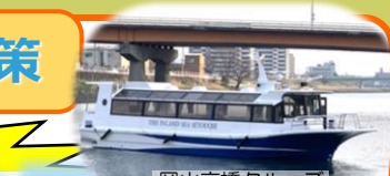
岡山京橋クルーズ