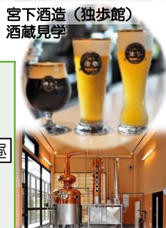
宮下酒造(独歩館) 酒蔵見学