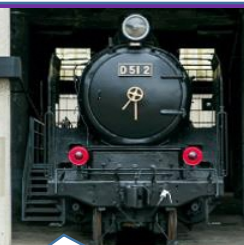
「D51形2号機」で学ぶ蒸気機 関車のしくみツアー付！