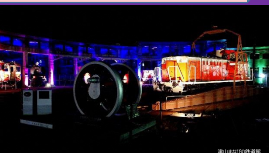
津山まなびの鉄道館