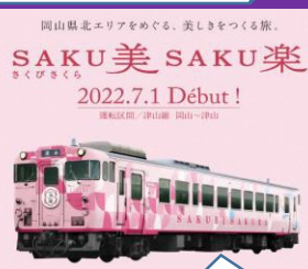
2022.7.1デビュー「SAKU美 SAKU楽」号にご乗車！