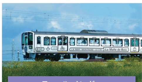
ラ・マル・ド・ボア

※旅行後のアンケート、イベント内容などのSNS発信にご協力をお願いを致します。 ※申し込み多数の場合は抽選となりますのでご了承下さい。