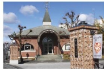
夢二郷土美術館 本館