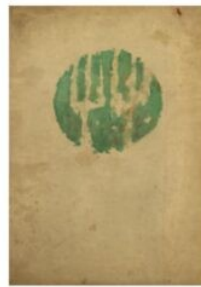
《スクラップブック「粋」表紙》

170点を超える浮世絵の発見！ 収録された多種多様なスクラップの中から夢二の蒐集した浮世絵についてご紹介します。