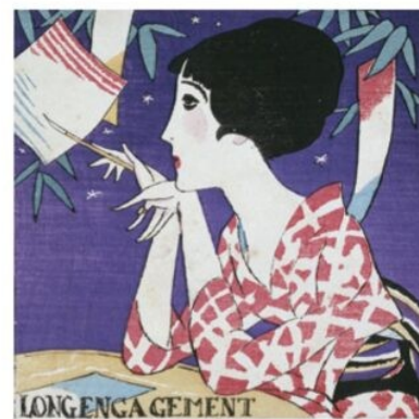
『婦人グラフ』第3巻第7号