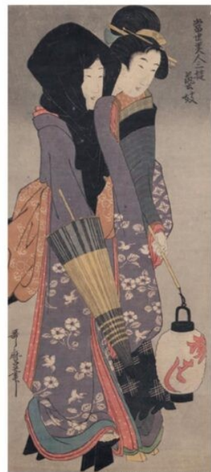
喜多川歌麿《当世美人三遊 芸妓》