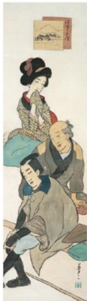
竹久夢二《沼津の平作》