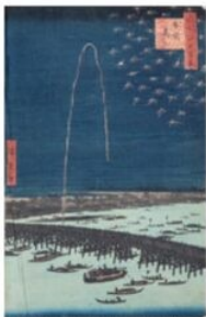
歌川広重《名所江戸百景 両国花火》