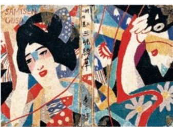
竹久夢二『三味線草』カバー