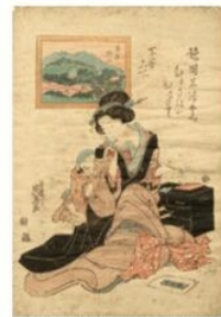
渡倉泉《諸国名勝くらべ 奥州郡山》

170点を超える浮世絵の発見！ 収録された多種多様なスクラップの中から夢二の蒐集した浮世絵についてご紹介します。