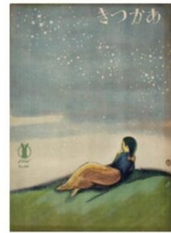
「セノオ楽譜(あかつき)」

夏の自然を身近に感じながら、 夢二が少年時代を過ごした生家で 時間を忘れてのんびりと 過ごしてみませんか。