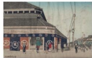
小林清親《大天馬町大丸》