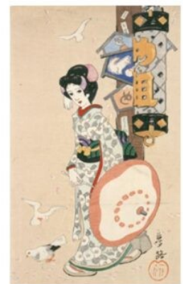
竹久夢二《満願の目》