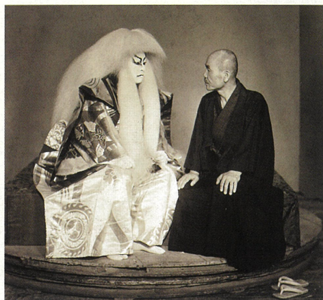
鏡獅子の扮装をした六代目尾上菊五郎と田中

The Art of Hirakushi Denchu — A Complete Retrospective