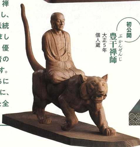
豊干禅師 大正5年 個人蔵