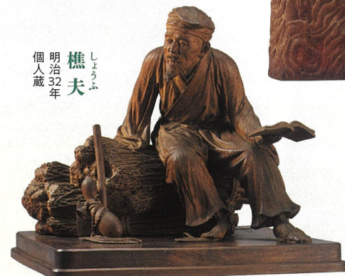
樵夫 明治32年 個人蔵