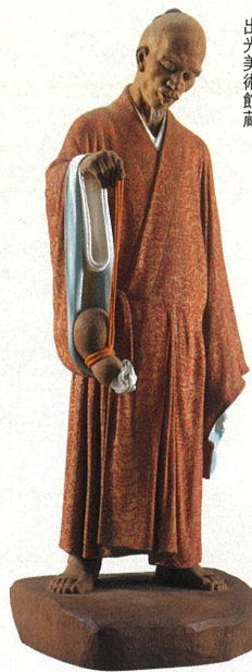
張果像 昭和17年 出光美術館蔵

リニューアルオープンして初となる、待ちに待った回顧展の開催です。《鏡獅子》と共に、全国各地から一堂に集めた名品約70点を全館展示します。