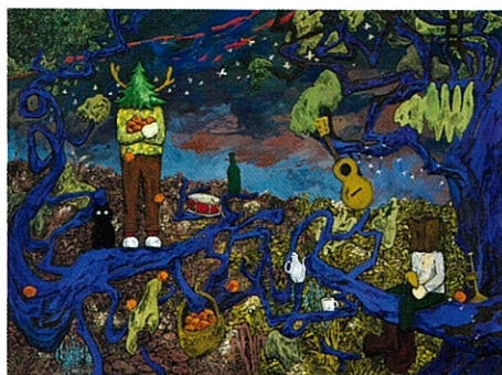
Lost in Thought 200, 2024, 248.5 × 333.3 cm, Acrylic on canvas