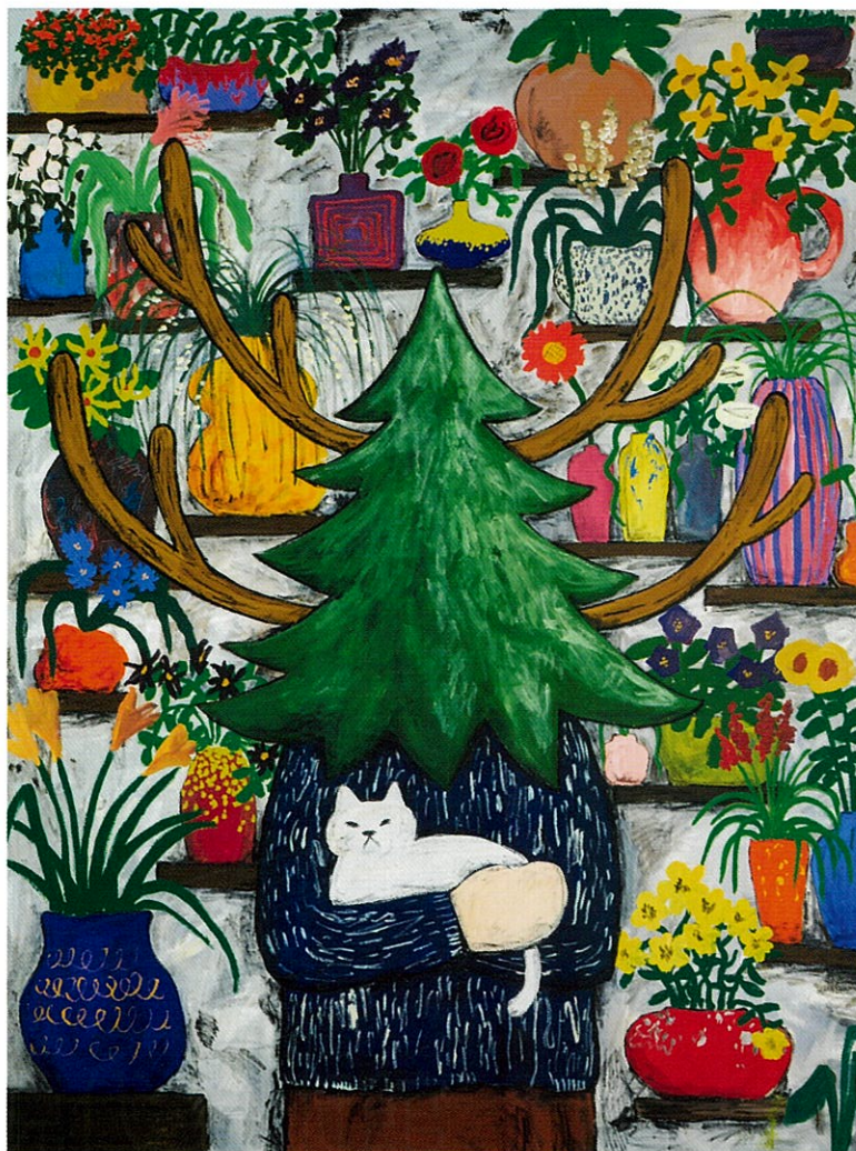
Green Master 82, 2023, 259.0 × 194.0 cm, Acrylic on canvas