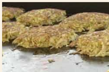
自然薯入りお好み焼