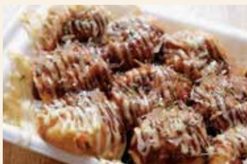
自然薯入りたこ焼き