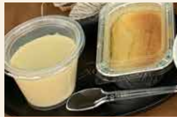
自然薯プリンとチーズケーキ