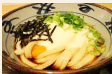
自然薯とろろうどん