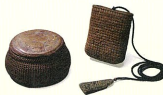
歌川広重遺品 煙草入れと袂落し