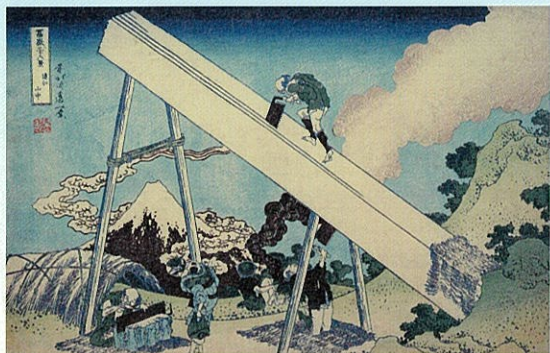
「富嶽三十六景 過江山中」葛飾北斎／画 1831～33年(天保2～4年)頃