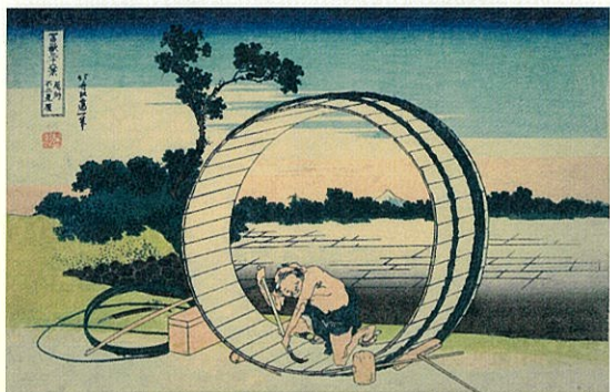
「富嶽三十六景 尾州不二見原」葛飾北斎／画 1831～33年(天保2～4年)頃

浮世絵風景画の名手である葛飾北斎(1760～1849)と歌川広重(1797～1858)。大胆な構図で知られる北斎、叙情性豊かな描写が際立つ広重、他の追随を許さないこの二人は、いかにして名作を生み出したのでしょうか。北斎は70年におよぶ画業の中で多様な制作活動が続けながら、そのひとつの到達点として「富嶽三十六景」をつくりました。一方、本作の刊行当時、いまだヒット作のない一介の絵師であった広重ですが、それ以後「東海道五拾三次之内」のように、北斎とは異なる方向で自らの画境を切り開いていきます。本展では、江戸東京博物館の所蔵する作品から、北斎の「富嶽三十六景全46点」のほか、「東海道五拾三次之内」「名所江戸百景」といった広重風景画の名作など、計213件を一挙公開し、二人の絵師の挑戦をたどります。