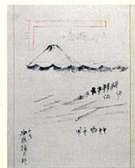
「三保松原図」安藤徳太郎(歌川広重)／筆 1806年(文化3年)