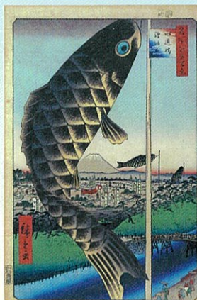
「名所江戸百景 水道橋駿河台」歌川広重／画 1857年(安政4年)