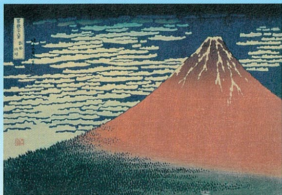
「富嶽三十六景 凱風快晴」葛飾北斎／画 1831～33年(天保2～4年)頃 【展示期間】6月7日～30日