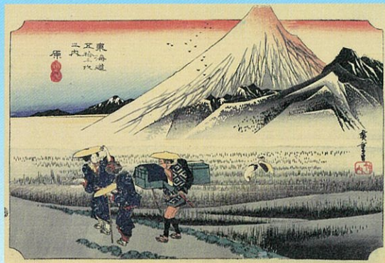
「東海道五拾三次之内 原 朝之富士」歌川広重／画 1834～36年(天保5～7年)頃

浮世絵風景画の名手である葛飾北斎(1760～1849)と歌川広重(1797～1858)。大胆な構図で知られる北斎、叙情性豊かな描写が際立つ広重、他の追随を許さないこの二人は、いかにして名作を生み出したのでしょうか。北斎は70年におよぶ画業の中で多様な制作活動が続けながら、そのひとつの到達点として「富嶽三十六景」をつくりました。一方、本作の刊行当時、いまだヒット作のない一介の絵師であった広重ですが、それ以後「東海道五拾三次之内」のように、北斎とは異なる方向で自らの画境を切り開いていきます。本展では、江戸東京博物館の所蔵する作品から、北斎の「富嶽三十六景全46点」のほか、「東海道五拾三次之内」「名所江戸百景」といった広重風景画の名作など、計213件を一挙公開し、二人の絵師の挑戦をたどります。