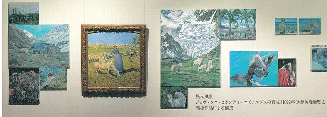
展示風景 ジョヴァンニ・セガンティーニ《アルプスの真昼》1892年(大原美術館蔵)と 高松作品による構成