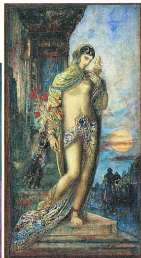
ギュスターヴ・モロー《雅歌》1893年 (大原美術館蔵)