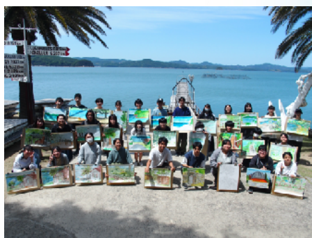
講師 邑久高校美術部