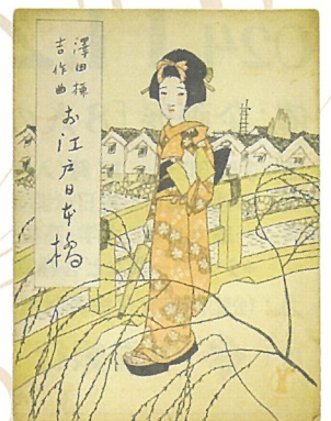
セノオ楽譜「お江戸日本橋」 (セノオ音楽出版社／大正5年) 表紙絵は夢二によるもの。