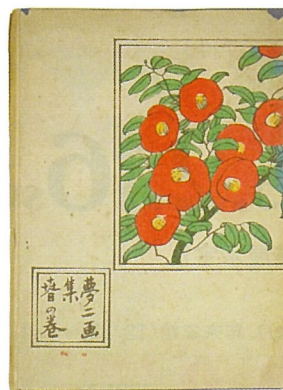
『夢二画集 春の巻』 (洛陽堂／明治42年)