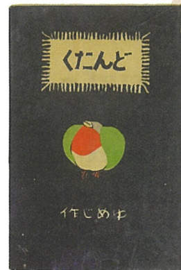
詩集『どんたく』 (実業之日本社／大正2年)