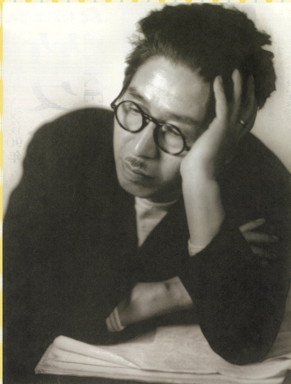
「夢ニポートレート」1932(昭和7)年頃 宮武東洋撮影 夢ニ郷土美術館蔵