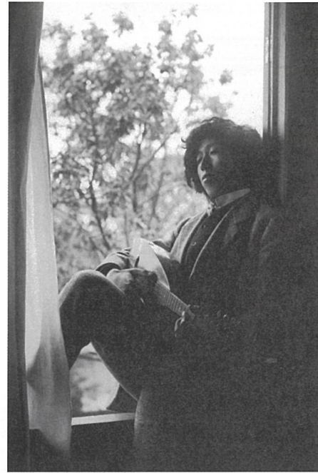
1910(明治43)年頃の夢二

2024年、画家・詩人の竹久夢二は、生誕140年・没後90年という節目の年を迎えます。 これを記念して、特別展「生誕140年・没後90年 竹久夢二展」を開催いたします。