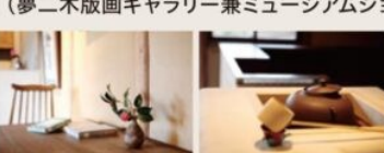
季節の和菓子「花火」