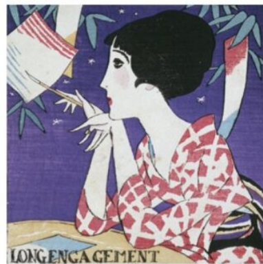
『婦人グラフ』第3巻第7号