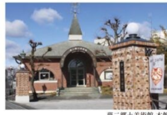
夢二郷土美術館 本館