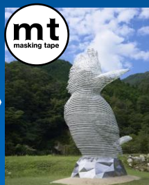
ジェンチョン・リウ《山に響くこだま》2024 / 森の芸術祭 岡山