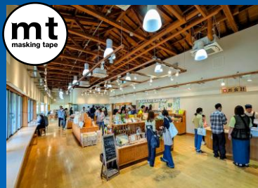
みずの郷 奥津湖ビジターセンター

JR岡山駅発着で、mt project 鏡野会場と「森の芸術祭 晴れの国・岡山」恒久設置作品の展示会場(鏡野町・奈義町・津山市)を効率よくラクに日帰り周遊できるバスを特別運行。