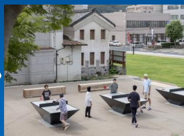
ジャコモ・ザガネツ(津山ピンポン広場)2024 / 森の芸術祭 岡山

湖畔の景色や食事を楽しめる施設が今年5月にリニューアルオープンしたのを記念して、倉敷発祥のマスキングテープブランド「mt」によるインスタレーションと期間限定ショップを展開!