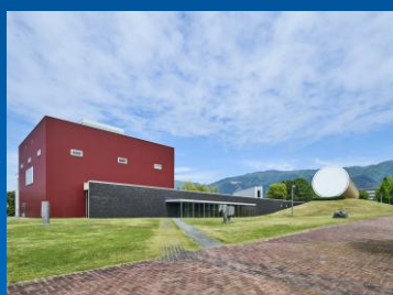
奈義町現代美術館