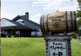
ひるぜんワイナリー

●集合・出発／真庭市役所本庁舎 10:00 ==旧遷喬尋常小学校==銘建工業本社CLT事務所==昼食(ろまん亭)・・・勝山町並み散策==佐田建美見学・組子体験==真庭あぐりガーデン(買い物)==版画アート毎来寺==真庭市役所本庁舎到着(17:15予定)