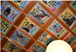
毎来寺(版画アート)