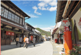
勝山町並み保存地区