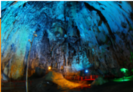
備中鍾乳穴(鍾乳洞)