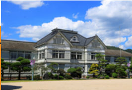
旧遷喬尋常小学校