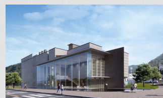
備前市美術館 グランドオープン