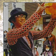
チャーリー (大道芸)