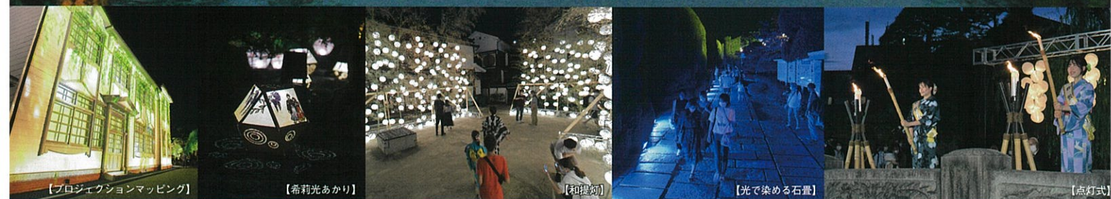
【プロジェクションマッピング】