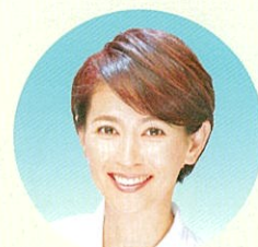
スペシャルアンバサダー 有森 裕子 さん (岡山県出身)