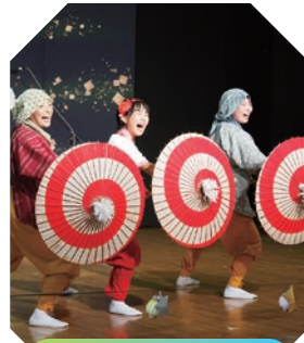
倉敷市芸文館 | アイシアター