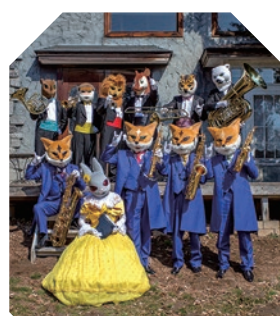
倉敷市芸文館 | ホール