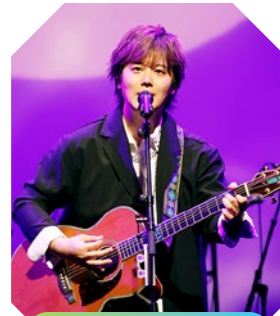
倉敷市芸文館 | ホール