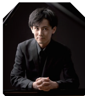
倉敷市芸文館 | アイシアター

一般4,000円、大学生以下500円(当日各500円増) ※就学前のお子様のご入場はご遠慮ください