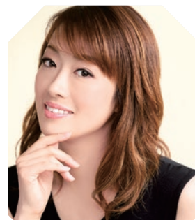
倉敷市芸文館 | ホール

一般2,000円、大学生以下500円(当日各500円増) ※就学前のお子様のご入場はご遠慮ください