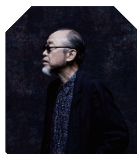
倉敷市玉島文化センター | ホール

一般4,000円、大学生以下500円(当日各500円増) ※就学前のお子様のご入場はご遠慮ください