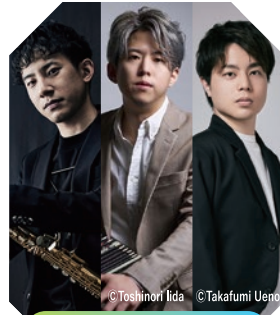
倉敷市芸文館 | ホール