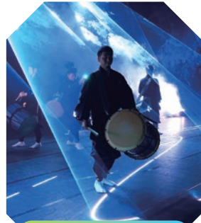
倉敷市芸文館 | ホール

関東ゆかりのアーティストや 特集地域にまつわる演目が勢揃い。 倉敷の町並みに拍手や喝采が響きます。