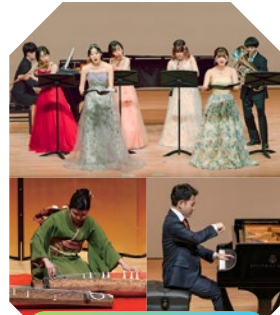
倉敷市芸文館 | ホール

一般4,000円、大学生以下500円(当日各500円増) ※就学前のお子様のご入場はご遠慮ください