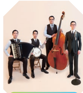
倉敷市芸文館 | ホール

一般4,000円、大学生以下500円(当日各500円増) ※就学前のお子様のご入場はご遠慮ください