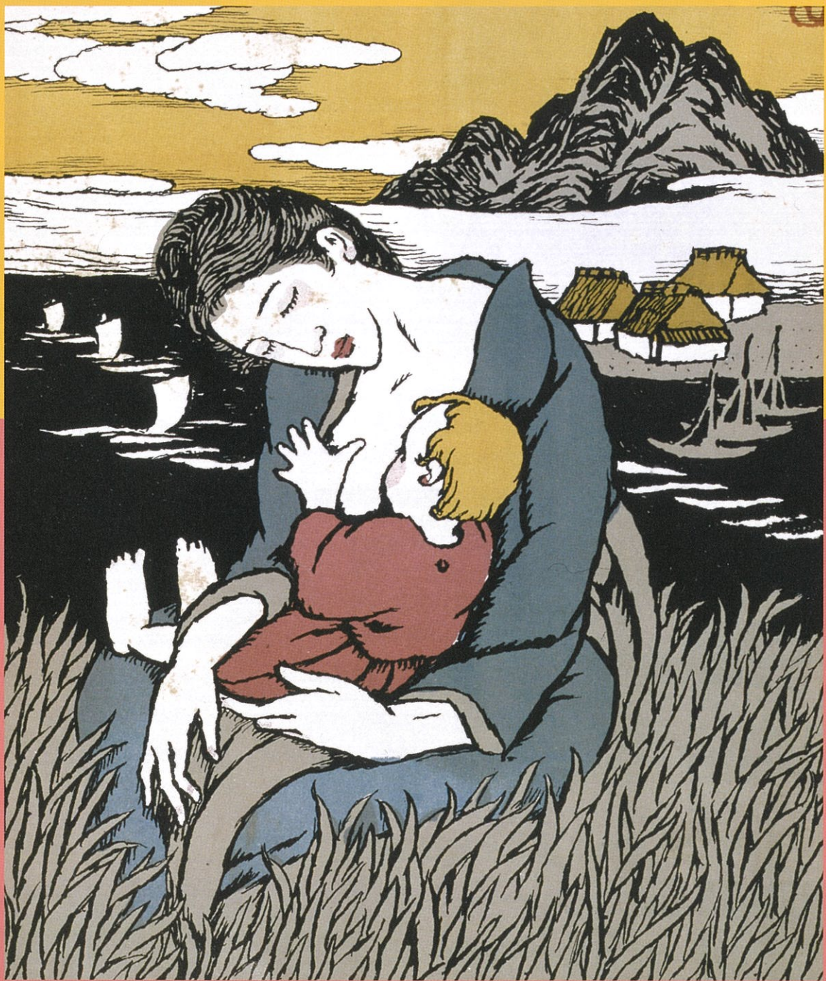
竹久夢二《セノオ楽譜「ふるさとの海」》