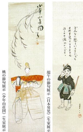
桃の節句展示 少年山荘図(生家展示)