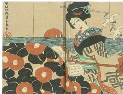
《TUMABIKI》「桜さく島 春のかはたれ」より