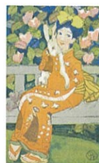
《風光る》 『女学世界』第12巻第5号より