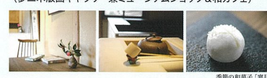
季節の和菓子「寒月」

お問い合わせ> 夢二郷土美術館 夢二生家記念館・少年山荘 〒701-4214 岡山県瀬戸内市邑久町本庄2000-1 Tel.0869-22-0622 Fax.0869-24-8003 ※上記イベント等は状況により変更の可能性がございます。あらかじめご了承ください。