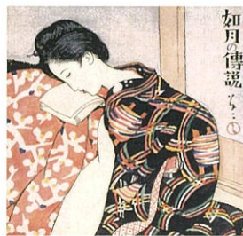
「婦人グラフィ第3巻第2号表紙」