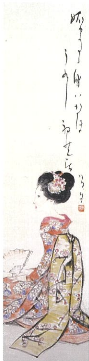
正月の催し展示《初芝居》