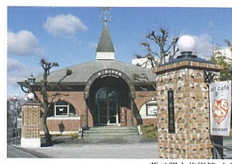
夢二郷土美術館 本館