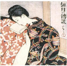
「婦人グラフィ第3巻第2号表紙」