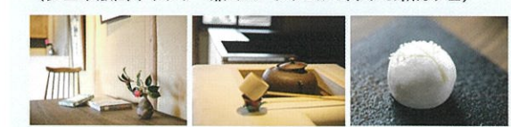
季節の和菓子「寒月」