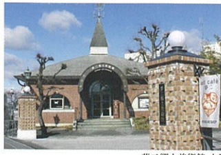
夢二郷土美術館 本館

バス JR岡山駅1番乗り場より後楽園方面行「蓬萊橋・夢二郷土美術館前」下車すぐ(※いずれも国電バス) 路面電車 JR岡山駅より東山行「城下」下車徒歩約15分 タクシー JR岡山駅より約10分 車 山陽自動車道岡山ICより約20分 徒歩 岡山後楽園より徒歩約3分