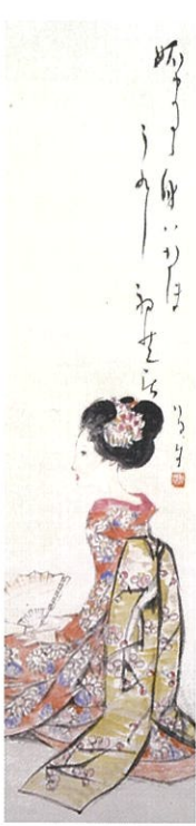
正月の催し展示《初芝居》