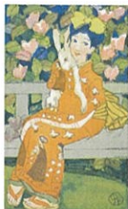
《風光る》 『女学世界』第12巻第5号より