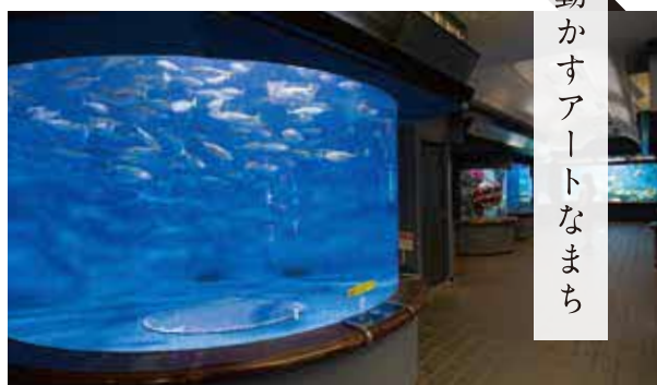
波川マリン水族館(玉野海洋博物館)