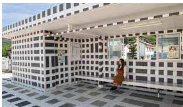
エステル・ストッカー「JR宇野みなと線アートプロジェクト(八浜駅)」