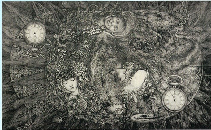
《生命の寛容と融合—0への回帰—》2024