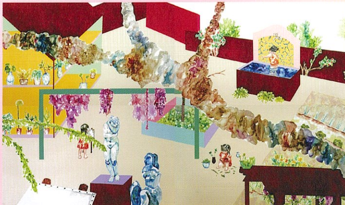
《イブとヴィーナス》2024