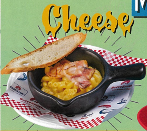
美星 三元 豚珍甘ベーコンのマカロニ&チーズ 備前白味噌のアクセント