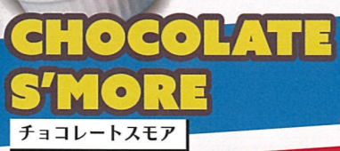
CHOCOLATE S'MORE チョコレートスモア