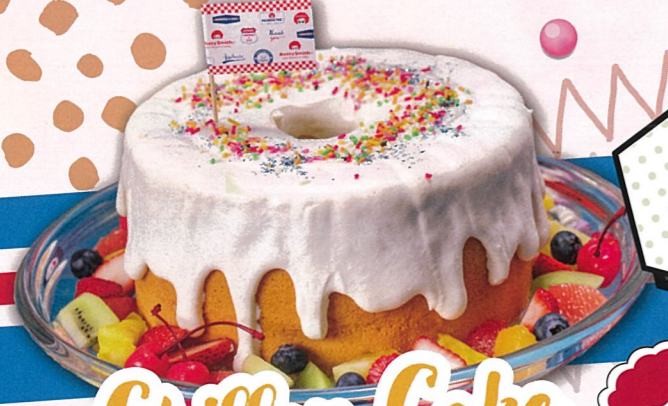
Chiffon Cake シフォンケーキ