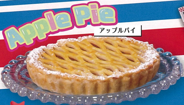
Apple Pie アップルパイ