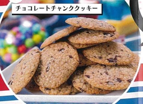
チョコレートチャンククッキー