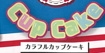
Cup Cake カラフルカップケーキ