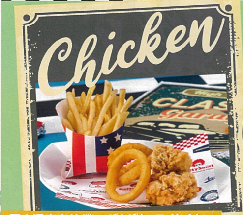
岡山県産森林どりのザクザクフライドチキン 紅だるまの刺激