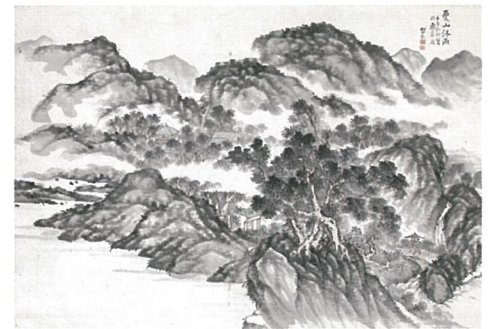
「夏山沐雨図」寛政4年(1792)個人蔵