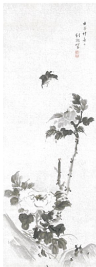
「牡丹蝶図」寛政4年(1792)個人蔵