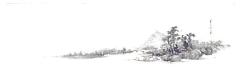
重要文化財「墨舟遊園図(墨水詩画卷)」文化元年(1804)広島県立歴史博物館蔵