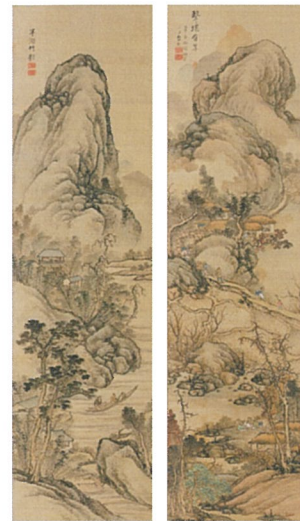
「山水図」寛政3年(1791)個人蔵