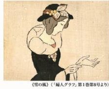
(雪の風)「婦人グラフィック第3巻第8号より」