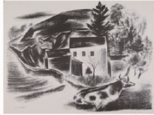
国吉康雄(作)の鳥籠