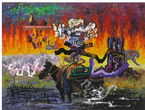
《ブラジルのカーボーイ VI》2024年