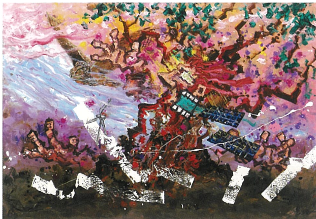
《Power of nature VI》2026年