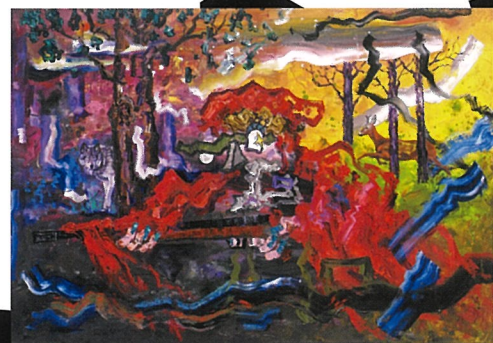
《狩猟中の赤頭巾IV》2026年