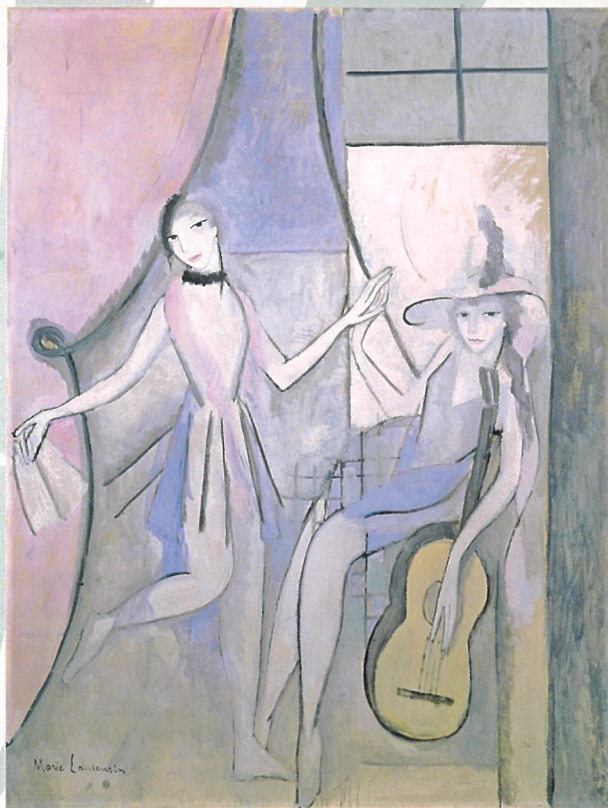
マリー・ローランサン《サーカスにて》(1913年頃、名古屋美術館)