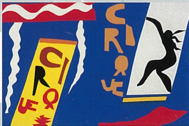
アンリ・マ蒂斯《『ジャズ』2サーカス》 (1947年、神奈川県立近代美術館)