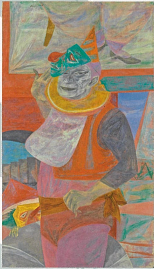
国吉康雄 《ミスターサーカス》 (1952年、福武コレクション)