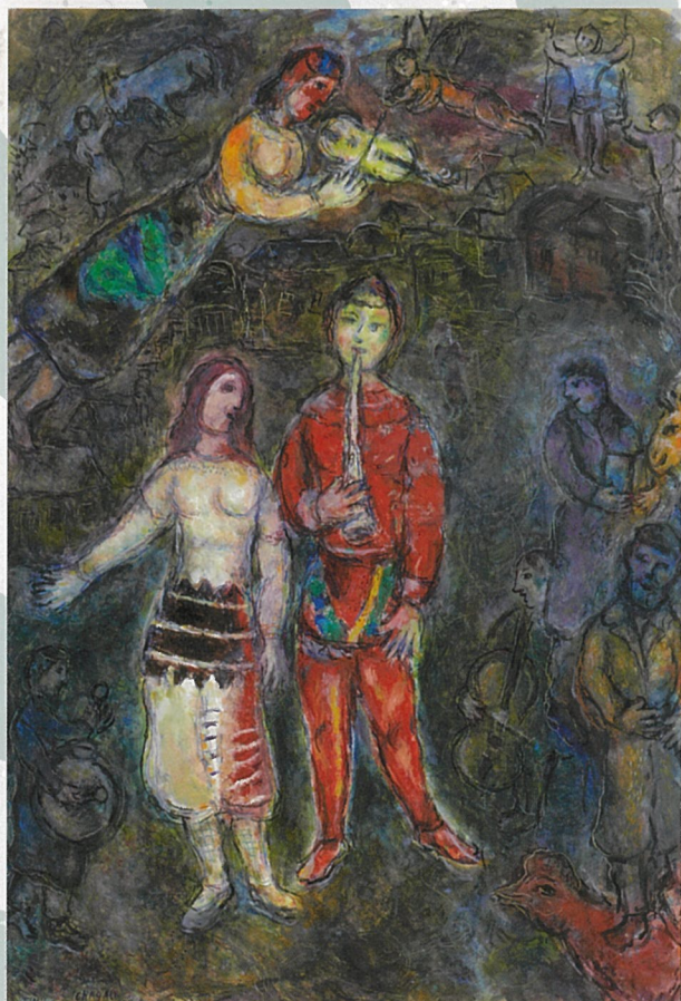
© ADAGP, Paris & JASPAR, Tokyo, 2026 G4223 マルク・シャガール《コンサート》(1974-75年、東京国立近代美術館)