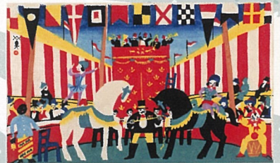
川西英《サーカス(曲馬)》(1928年、神戸市立博物館)

18世紀ヨーロッパで始まったとされる近代サーカスは幕末に日本へ渡来し、現代に至るまで多くの人々を魅了してきました。