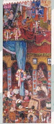
児島虎次郎 《木下サーカス(2)》 (1917年頃、 高梁市成羽美術館)