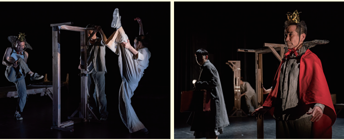
古典名作劇場シリーズ第3弾「はだかの王様」