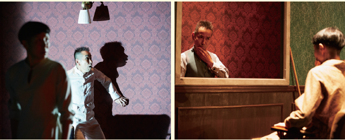
「どこまでも世界」