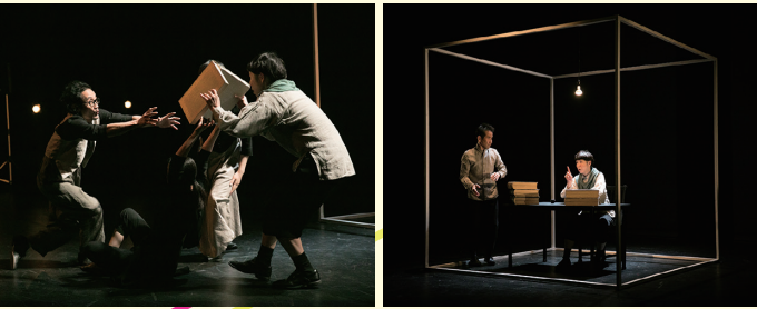
古典名作劇場シリーズ第2弾「ドン・キホーテ」