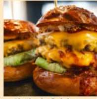
牛乳産食材の 限定バーガー