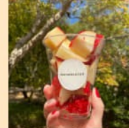
子供に安心の フルーツ飴