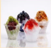
地元産フルーツ シロップ