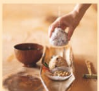
無農薬無添加 おむすび