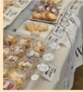
米粉チーズケーキ