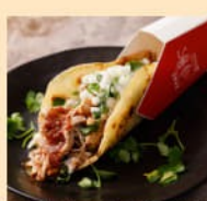
岡山産豚肉のタコス