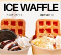
ワッフルスティック