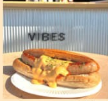
マルシェ限定 ホットドッグ