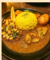
オリジナル スパイスカレー