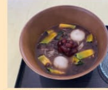
黒皮かぼちゃぜんざい