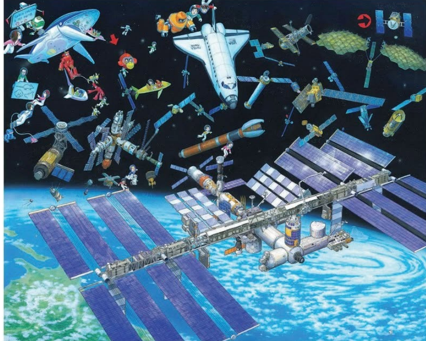
宇宙ステーション (『宇宙の迷路』より 2011年)

この展覧会では、迷路絵本シリーズの原画75点などを一堂にご紹介するとともに、実際に指で触れて迷路を楽しめる工夫もしています。ご家族やお友達と「迷路の世界」をお楽しみください。