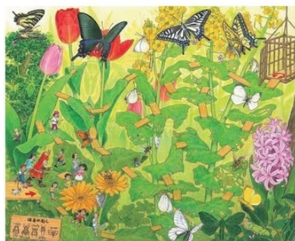
チョウの花園 (『昆虫の迷路』より 2010年)