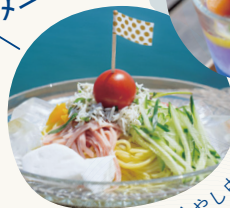
牛窓しらすの冷やし中華