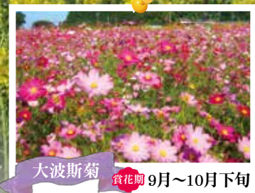
大波斯菊 賞花期 9月~10月下旬