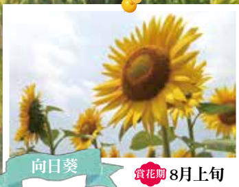
向日葵 賞花期 8月上旬