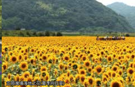
笠岡灣填海之花(夏季向日葵)