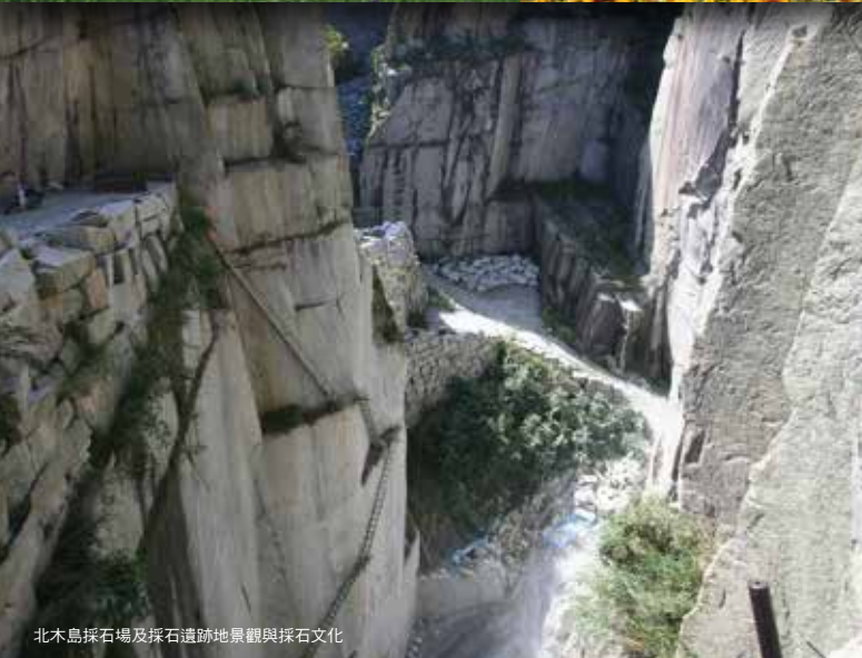
北木島採石場及採石遺跡地景觀與採石文化