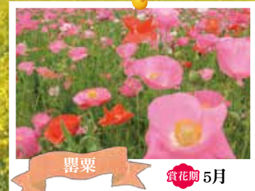
罌粟 賞花期 5月