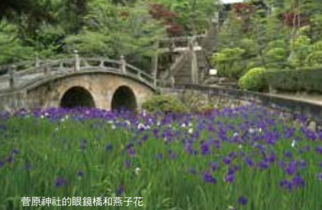
菅原神社的眼鏡橋和燕子花