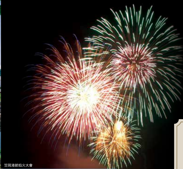
笠岡港節焰火大會