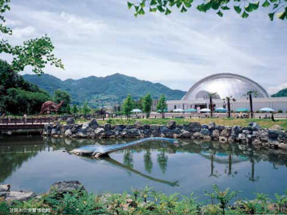
笠岡市立兜蟹博物館