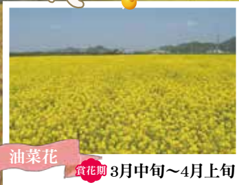
油菜花 賞花期 3月中旬~4月上旬